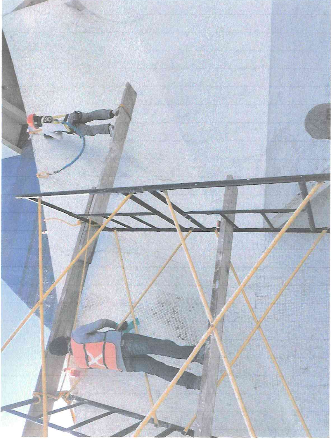
Limpieza y liberación de agregados de la tesela sobre la barandas de gradas en el sector B2.