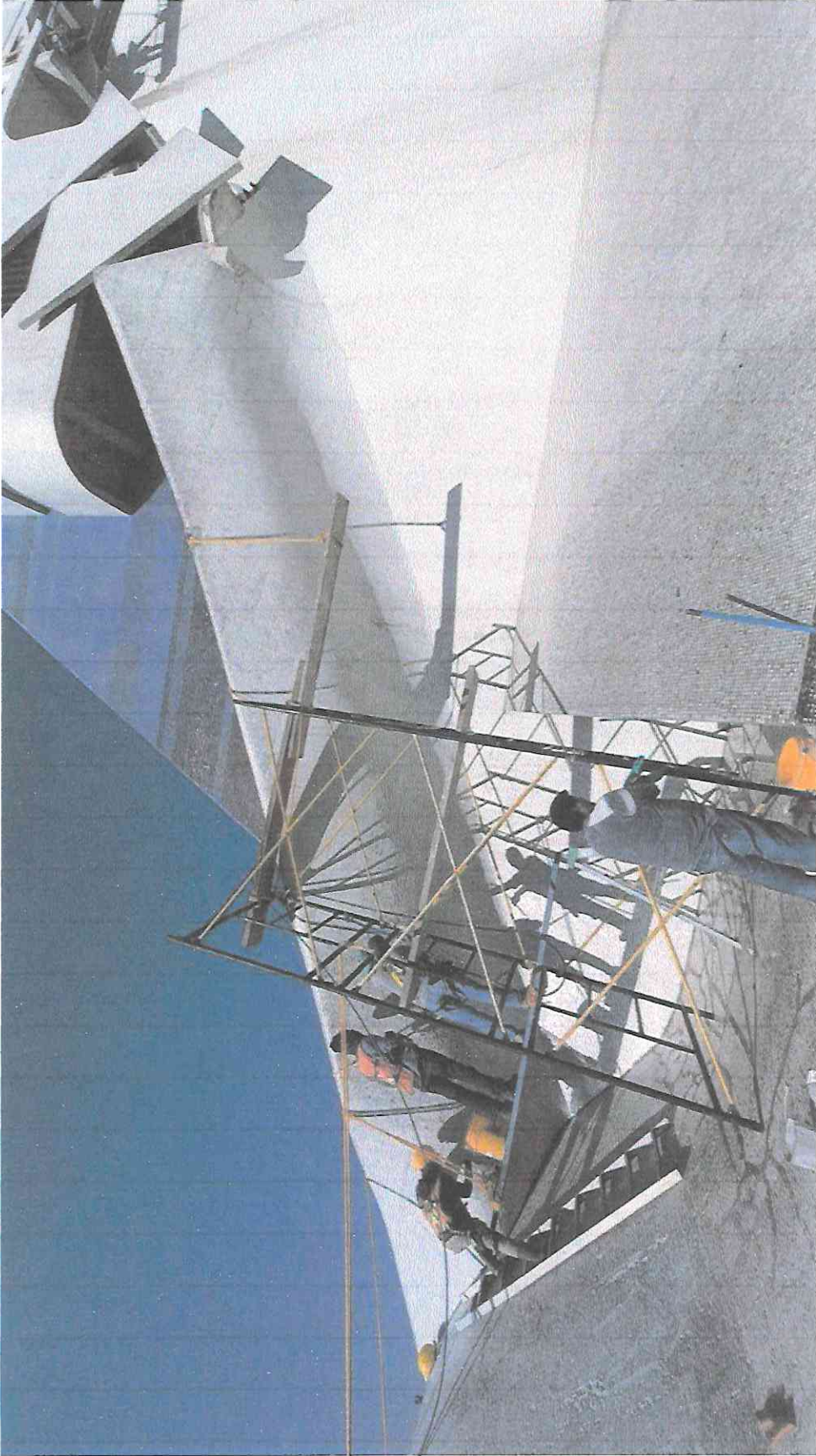
Desinfección de la tesela del sector B2.